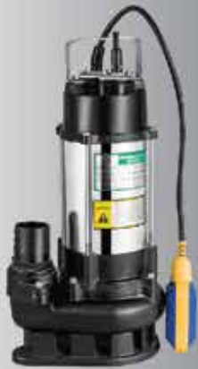
ویژگی های ساختاری