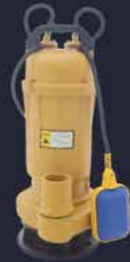
ویژگی های ساختاری